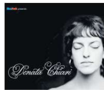
Das Album-Cover

Eine dieser Sessions wurde zuletzt zum Ausgangspunkt für